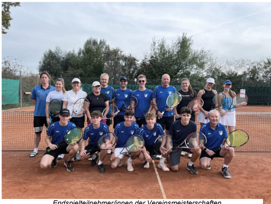
Endspielteilnehmer/innen der Vereinsmeisterschaften

Im Anschluss an die Spiele fand die Siegerehrung statt und danach ließen alle Spieler und Spielerinnen sowie die Zuschauer den Abend mit einem gemeinsamen Vesper ausklingen.