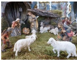
Krippe in St. Martinus, Hausen am Bussen