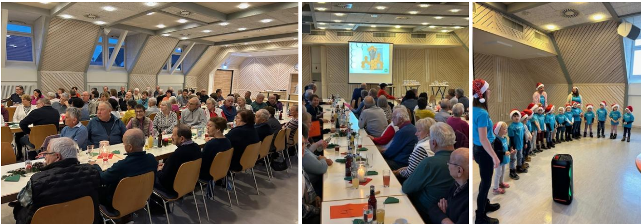
Bilder: Senioren beim Dalli Klick-Spiel, Kindergartenkinder beim Singen

Die Kosten dieses Seniorenachmittags teilen sich die Kirchengemeinde und die bürgerliche Gemeinde je zur Hälfte. Herzlicher Dank gilt den Aerobicfrauen sowie alle weiteren beteiligten Personen, die zum Gelingen des Nachmittags beigetragen haben. Über die rege Teilnahme haben sich die Veranstalter sehr gefreut.