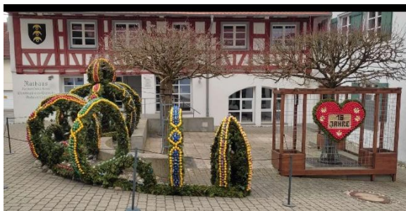
Eine von 14 Stationen des Kreuzweg, Osterbrunnen 2026