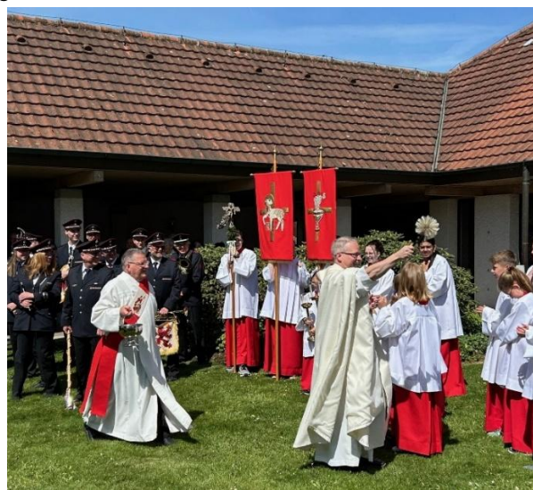
Gez. Handgrätinger, Bürgermeister